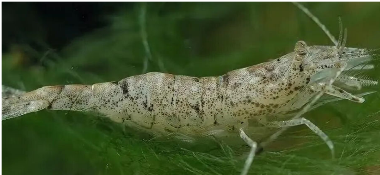
Рис. 3. Креветка вида Crangon crangon (Devriese et al., 2015).

мерному классу микропластика (менее 5 мм), с количеством от 1 до 7 частиц на рыбу, и почти 40% частиц состояли из полиэтилена. Инцидентность проглатывания пластика была достоверно выше у пелагических видов по сравнению с придонными (10,7% против 3,4%). Однако остается невыясненным, было ли потребление микропластика рыбами в рассмотренных исследованиях прямым или являлось следствием трофического переноса (Rummel et al., 2016).