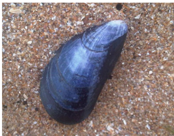
Рис. 4. Мидия Mytilus edulis .

Исследователи применяют оценку риска для изучения воздействия микропластика на экосистемы и здоровье человека (Беляев и др., 2024 а). Оценка потенциальных проблем для здоровья, связанных с воздействием микропластика на организм, упрощается путем расчета коэффициентов опасности на основе концентрации микропластика в исследуемых образцах. Важными аспектами этих подходов являются сезонные колебания и временная динамика. Исследования, проводимые в разные сезоны, позволяют понять, как деятельность человека и климатические условия влияют на распространение микропластика (Седлецкий и др., 2025б). Изучение изменений в распределении типов микропластика в различные периоды внешних воздействий, таких как карантинные меры, связанные с COVID-19 (Song et al., 2022), позволило углубить наше